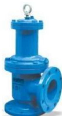
液压、气动角式快开排泥阀

公称通径: DN50~400mm 公称压力: PN1.0、1.6MPa 使用温度: -10℃~120℃ Nominal diameter: DN50~400mm Nominal pressure: PN1.0、1.6MPa Operating temperature: -10℃~120℃