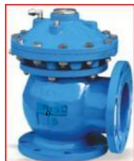
膜片式快开排泥阀

公称通径: DN10~25mm 公称压力: PN1.0、1.6MPa 使用温度: -10℃~120℃ Nominal diameter: DN10~25mm Nominal pressure: PN1.0、1.6MPa Operating temperature: -10℃~120℃