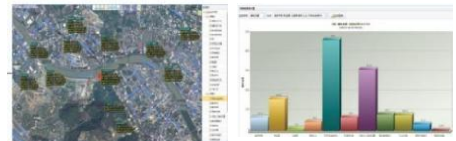
供水管网远程监控分析与接口系统 (SCADA)