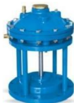
隔膜式池底卸泥阀

公称通径: DN100~400mm 公称压力: PN1.0、1.6MPa 使用温度: -10℃~120℃ Nominal diameter: DN100~400mm Nominal pressure: PN1.0、1.6MPa Operating temperature: -10℃~120℃