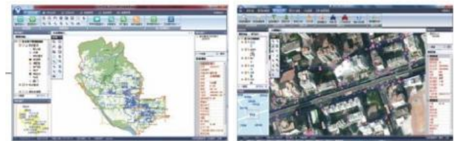
供水管网地理信息系统 (GIS)

INTELLIGENT VALVE SERIES BASED ON INTERNET OF THINGS